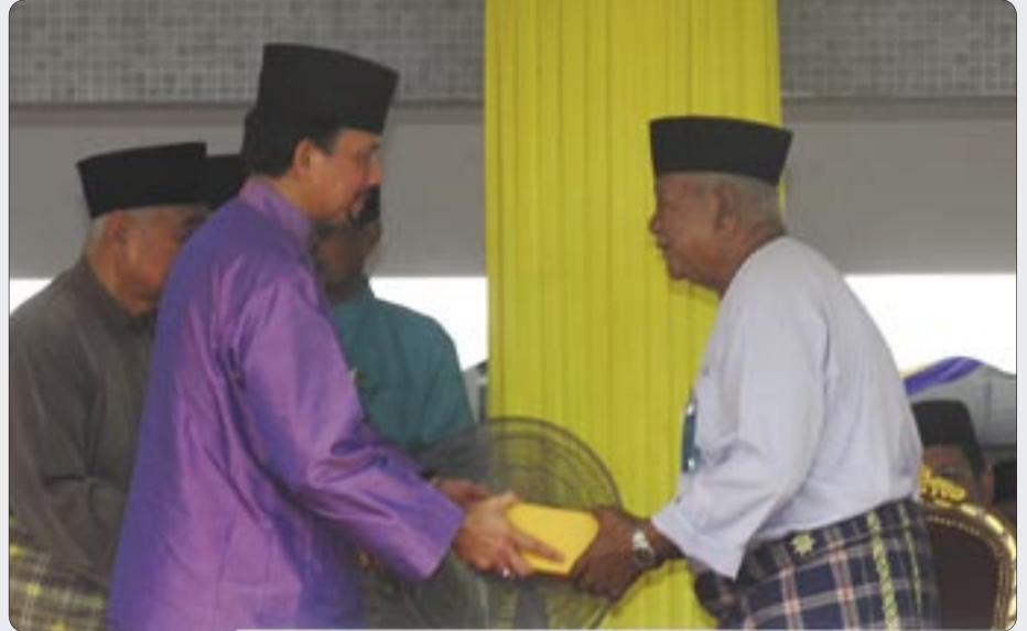
Kebawah Duli Yang Maha Mulia Paduka Seri Baginda Sultan Haji Hassanal Bolkiah Mu'izzaddin Waddaulah, Sultan dan Yang Di-Pertuan Negara Brunei Darussalam berkenan mengurniakan daging-daging korban kepada salah seorang penerima yang terpilih dari Daerah Brunei dan Muara.

kambing dan 46 ekor sapi dikorbankan di Majlis Korban Sunat Kebawah Duli Yang Maha Mulia Paduka Seri Baginda Sultan dan Yang Di-Pertuan Negara Brunei Darussalam dan kerabat baginda.