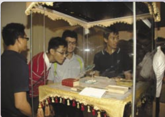
Anggota Angkatan Pertahanan Singapura (Singapore Armed Forces) tertarik dengan salah sebuah Mushaf kecil yang dipamerkan di BPISHHB.

Keempat, Jabatan Belia dan Sukan dan peserta Program Syifa Ul-Insan, Anggota Batalion Pertama Tentera Darat Diraja Brunei.