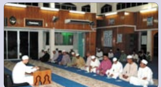
Suasana ketika sesi Kuliah Subuh diadakan di Masjid Kampong Pelambayan.