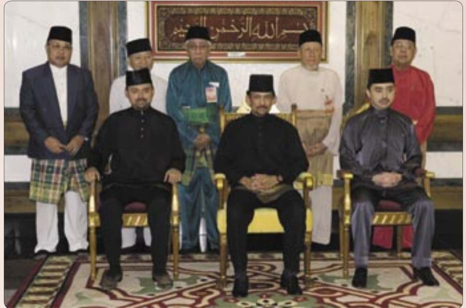
Kebawah Duli Yang Maha Mulia Paduka Seri Baginda Sultan Haji Hassanal Bolkiah Mu'izzaddin Waddaulah, Sultan dan Yang Di-Pertuan Negara Brunei Darussalam dan putera-putera baginda berkenan bergambar bersama penerima-penerima Anugerah Jasawan Ugama dan Bakti Hijrah.

Sesuai dengan semangat hijrah, baginda bertitah menyeru semua orang, terutama para pemimpin dan pembantu-pembantu mereka, perlu lebih peka dengan perkembangan semasa, sama ada yang bersangkutan dengan tugas harian masing-masing mahupun yang lebih besar daripadanya.