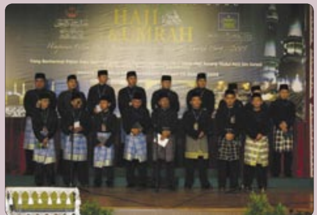
Majlis Ibadah Korban pada hari tersebut turut diserikan dengan persembahan Tausyih Selawat Ibrahimiah gabungan pegawai-pegawai Jabatan Mufti Kerajaan dan Syarikat Penerbangan Diraja Brunei.