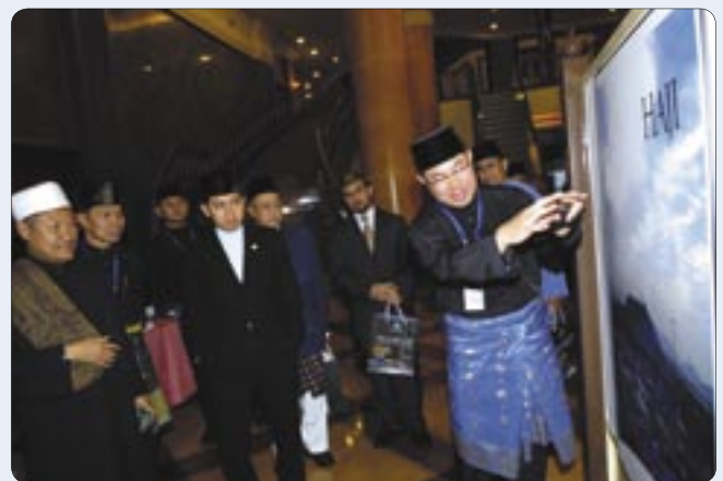
Setelah majlis pelancaran, para jemputan berkesempatan menyaksikan mini pameran daripada Darussalam Holdings Sendirian Berhad dan Jabatan Mufti Kerajaan.