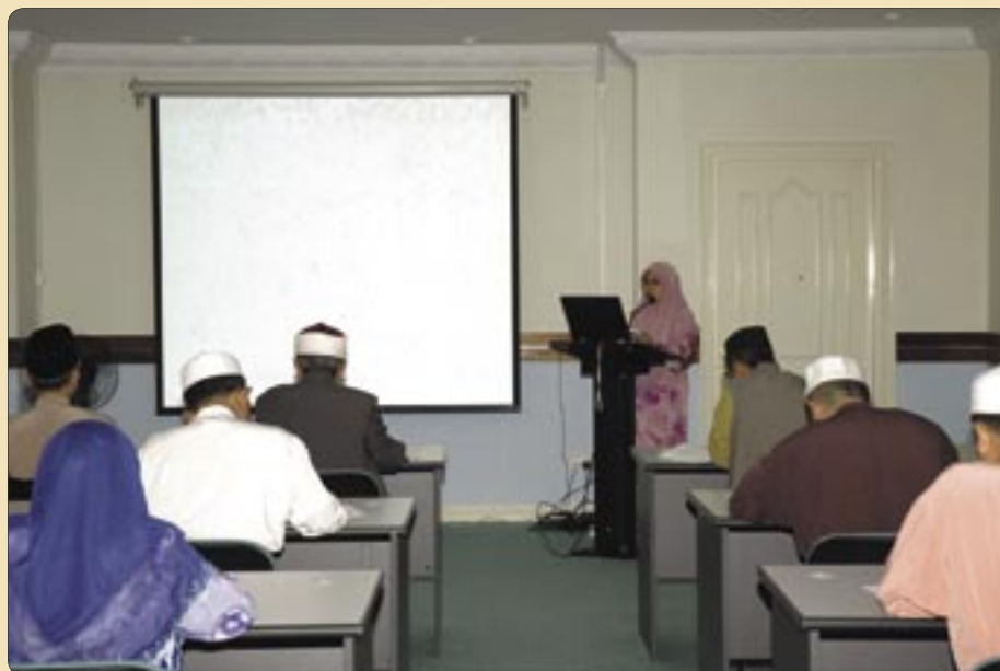
Suasana ketika sesi pembentangan diadakan.

Bagi melahirkan pegawai yang cekap dan berkemahiran, Jabatan Mufti Kerajaan, Jabatan Perdana Menteri pada 3 Muharram 1430 bersamaan 31 Disember yang lalu telah mengadakan Program Latihan Pembentangan Kertas Kerja bertempat di Syuura 3, Darulifta' Brunei Darussalam.