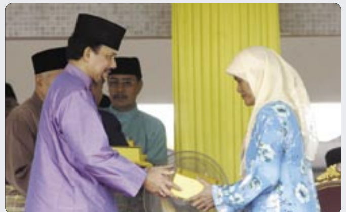
Kebawah Duli Yang Maha Mulia Paduka Seri Baginda Sultan Haji Hassanal Bolkiah Mu'izzaddin Waddaulah, Sultan dan Yang Di-Pertuan Negara Brunei Darussalam berkenan menyempurnakan Ibadah Korban Sunat baginda dan kerabat baginda kepada seorang asnaf penerima.

Brunei dan Muara dan daging-daging korban selebihnya diserahkan di majlis penyerahan yang diadakan di keempat-empat daerah dan diagih-agihkan kepada sejumlah 3,807 orang fakir miskin iaitu 2,216 orang dari Daerah Brunei dan Muara, 578 orang dari Daerah tutong, 775 orang dari Daerah Belait dan 238 orang penerima dari Daerah Temburong.