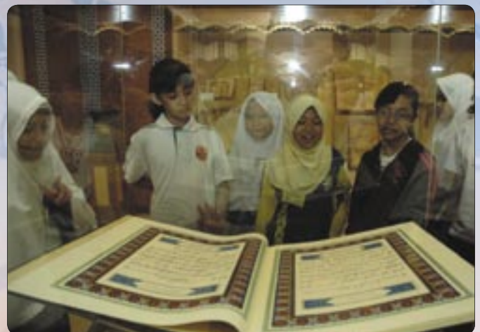
Murid-murid dari Princess Elizabeth Primary School, Singapura dan Sekolah Rendah Serasa, Muara ketika mengadakan lawatan ke BPISHHB.